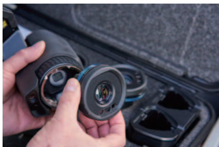
AutoCal™ 光学によりシリーズの全カメラでレンズ (広角から望遠) の共有が可能