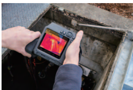
最大161,472ピクセルの高解像度