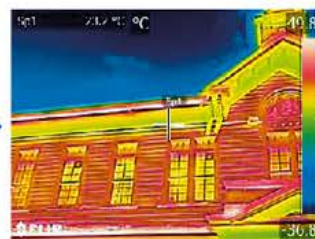
MSX ® モード