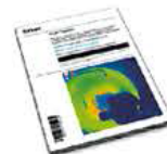
ソフトウェアライセンス FLIR Tools+ ¥60,000