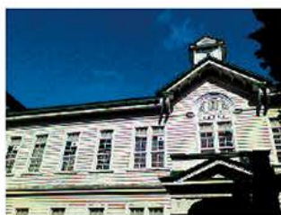
デジタルカメラモード

MSX ® 機能(スーパーファインコントラスト機能)は、リアルタイムで画像を補正することができ、構造物の詳細や発熱箇所の判別が熱画像上で容易に行えます。また、デジタルカメラモードとの同時撮影も可能で、同画角の可視画像を簡単に生成することができます。